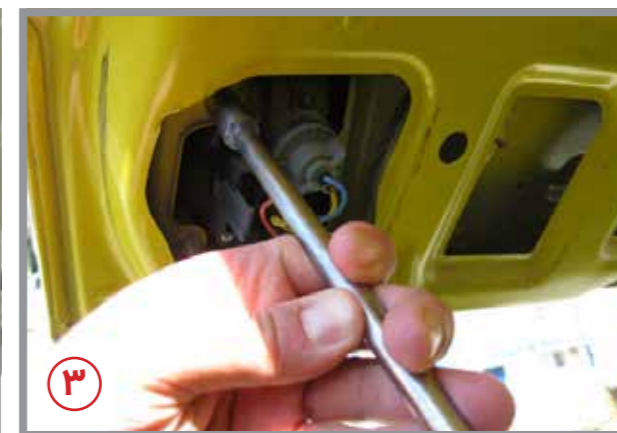
۲ - در این مرحله با استفاده از آچار بکس، شروع به باز کردن مهره های پیچهای چراغ خطر کنید. (مطابق شکل ۳)

نکته در مورد چراغهای خطر سمند تعداد پیچها ۳ عدد می باشد و در برخی چراغهای خطر دیگر نظیر خطر خودروی پارس و ۴۰۵ تعداد پیچها ۴ عدد می باشند.