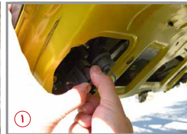
۱ - سوکت تامین برق چراغ خطر را بیرون بکشید تا کاملا آزاد شود. (مطابق شکل ۱ و ۲)